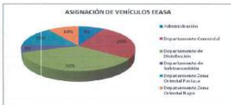
Gráfico No. 1 Fuente: Distribución de vehículos EEASA año 2017

De acuerdo al Manual de Competencias del Sistema de Gestión de Calidad, en el anexo Funciones de cada puesto de trabajo, la Administración de los vehículos se encuentra a cargo del Jefe de Sección Transporte, quien coordina su utilización en base a las necesidades institucionales.